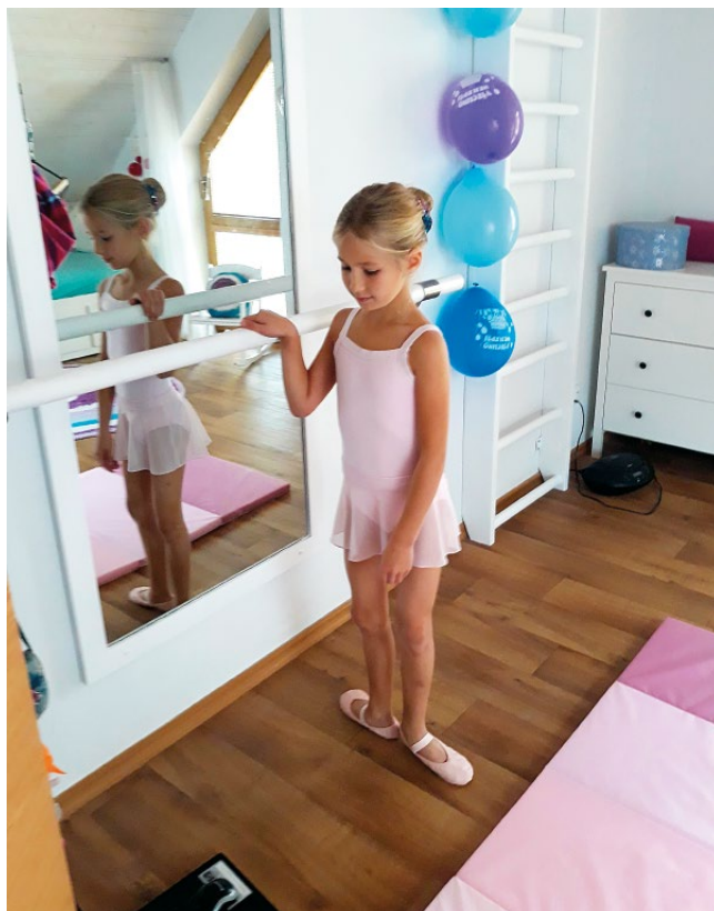
Kromě mnoha jiných nabízí ZUŠ Chrudim také taneční obor