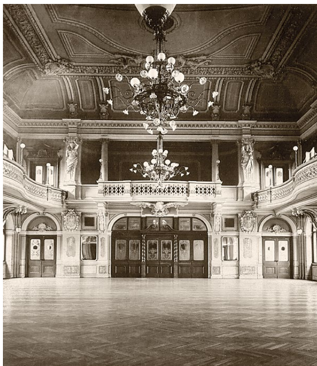
„Velká dvorana“ novobarokní budovy čp. 85/IV v roce 1901

Zážitky ze zpřístupnění novobarokní muzejní budovy zcela jistě zanedlouho většině z přítomných splynuly s dojmy z obdobných zdejších slavností, jen asi nádherná, slavnostně vyzdobená dvorana zůstala trvale uchována v paměti přímých svědků této události. Tento 362 m 2 velký, 11,8 m vysoký sál vroubený ve výšce 4,5 m galerií nadchl i zpravodaje místních novin: „Lehkou vzdušnou klenbu stropu nese 14 karyatid. Bohatý ornamentální vlys zdoben jest čtyřmi krásně provedenými kartušemi s městskými znaky. Podél vnitřního pole a v čele stropu hledí dolů ženské alegorické postavy ušlechtilých tvarů. Voluta pod stropem ozdobena jest rovněž 18 kartušemi korunovanými mléčnými koulemi s elektrickým světlem, na způsob oněch, jež rozžháný bývají při slavnostních představeních Národního divadla. Čelná galerie pro orchestr sebečtetnější spočívá na rozepjatém orlu v nadpřirozené velikosti; po stranách na hlavních sloupech